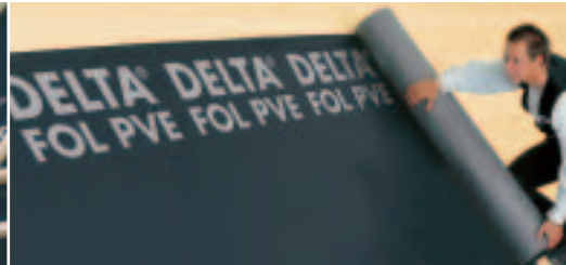
Uitstekend geschikt als beschotfolie.