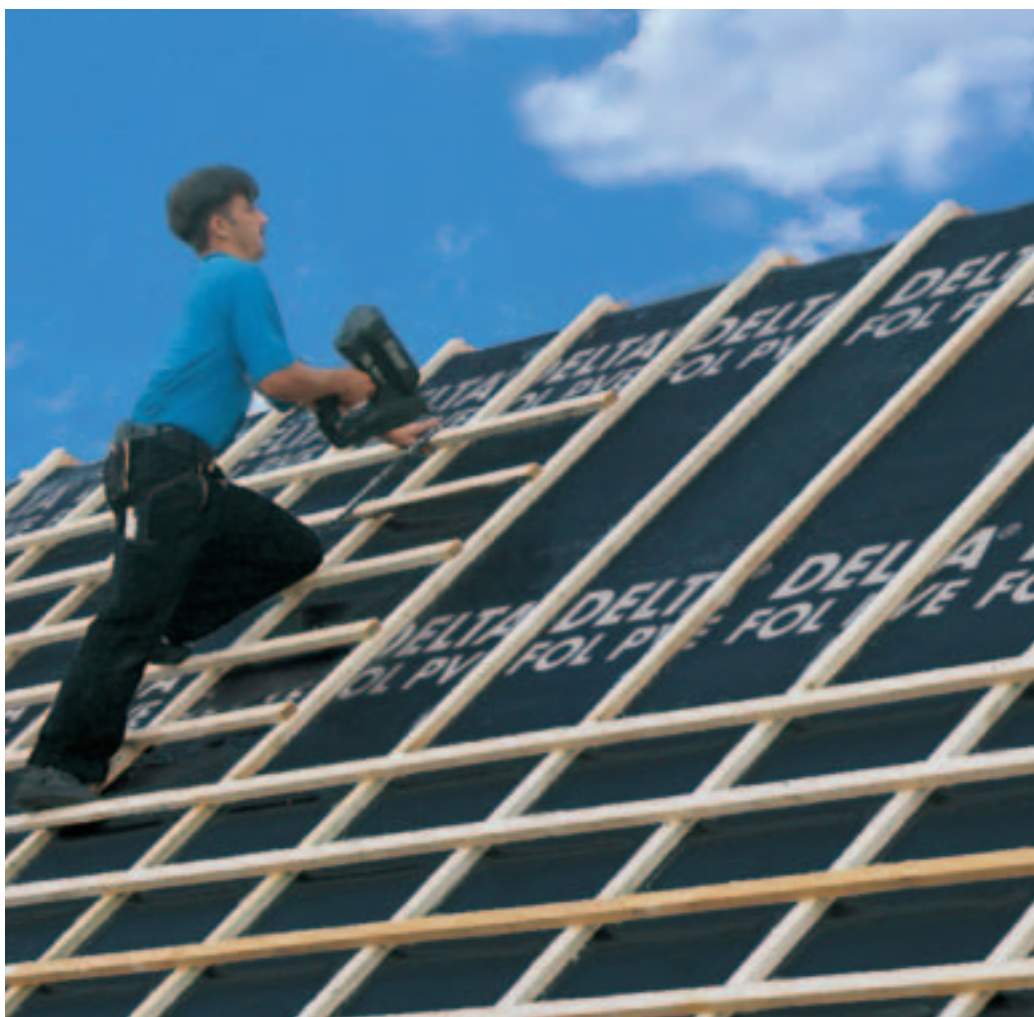
DELTA®-FOL PVE garandeert een ideale bescherming en laat zich gemakkelijk plaatsen.