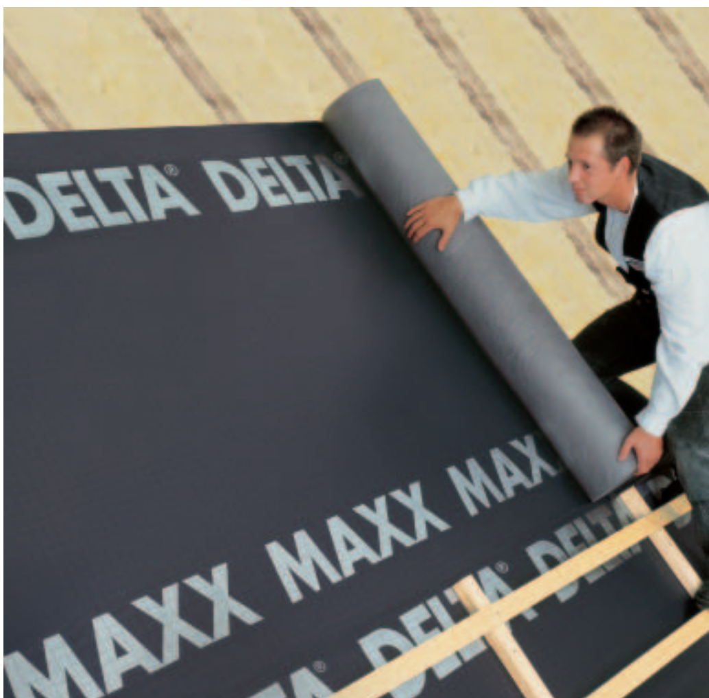
DELTA®-MAXX – voor daken met een isolatie op de ganse keperhoogte.