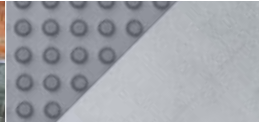
DELTA®-PROFIEL met DELTA®-GEO-DRAIN CLIP.