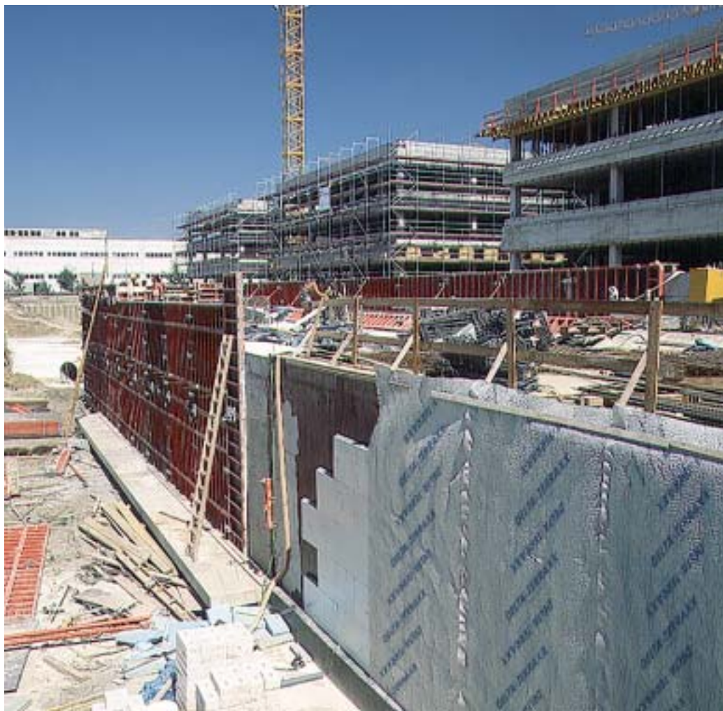
DELTA®-TERRAXX tegen wandisolatie biedt een maximum aan bescherming.