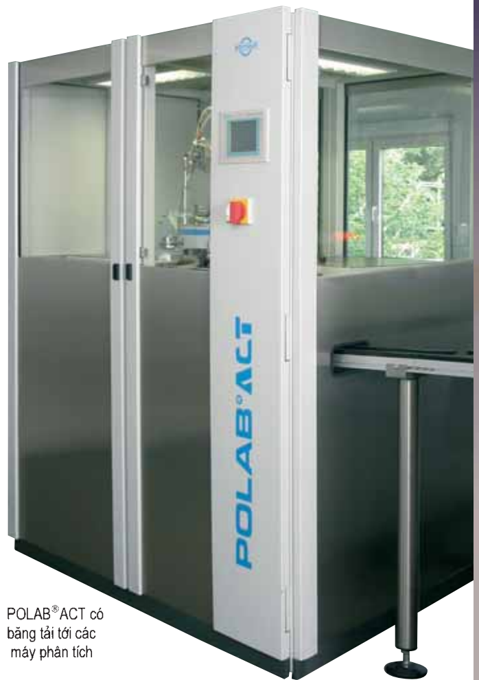
POLAB ® ACT có băng tải tới các máy phân tích

POLAB ® ACT cho ta sự linh hoạt cao nhất trong lúc xác định liều lượng và phân bố các mẫu nhận được một cách tự động hoặc được đưa vào bằng tay và đáp ứng những yêu cầu khắt khe về độ lặp lại và tính không bị nhiễm bẩn.