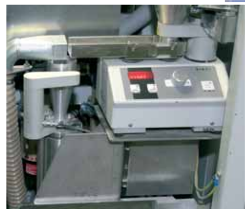
Máy đo độ hạt laser tích hợp để phân tích độ mịn của xi măng hoặc mẫu bột thô.

trình tại xưởng nhờ một phần mềm. Phần mềm POLAB® được POLYSIUS xây dựng theo công nghệ mới nhất và chạy trên nền Windows, bảo đảm điều khiển một cách tốt nhất quá trình thông qua việc sử dụng các chiến lược điều khiển sáng tạo, mạng neuron, thuật toán trên cơ sở tri thức và hệ thống phân tích cluster. Việc sử dụng hệ thống POLAB® với phần cứng và phần mềm tính năng cao vào việc theo dõi chất lượng, cùng với việc ứng dụng có hệ thống các hệ tối ưu hóa hiện có vào việc điều khiển tối ưu quy trình là một bước đi tiên tiến bảo đảm cho việc sản xuất xi măng đạt chất lượng cao.